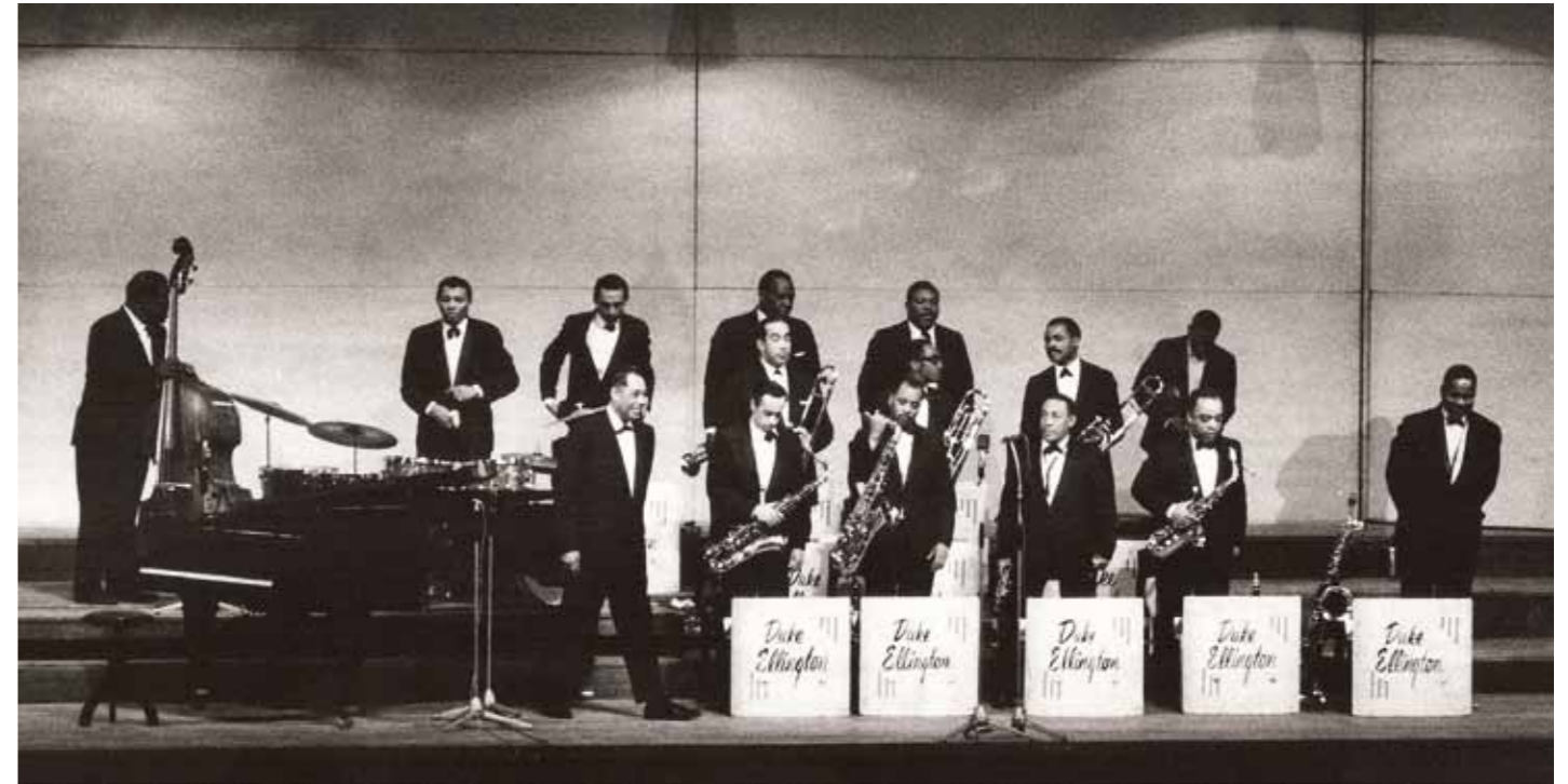
Duke Ellington Orchestra (1963)

Duke Ellington gilt bis heute als einer der einflussreichsten Komponisten der Jazzgeschichte. Die genaue Anzahl seiner Werke ist nur schwer nachvollziehbar, aber man geht davon aus, dass es ca. 2.000 Stücke sind, die er alleine oder in Zusammenarbeit mit befreundeten Musikern (allen voran mit seinem kongenialen Partner und Arrangeur Billy Strayhorn) geschrieben haben muss. Ellington sah sich weniger als Pianist, sondern als Komponist, der sein Orchester als Instrument benutzte. Er experimentierte mit Klangfarben, instrumentalen Effekten (z. B. dem „Growl“-Effekt der Blechbläser) und ungewöhnlichen Voicings und schuf auf diese Weise einen unverkennbaren Sound, den Billy Strayhorn später als „Ellington Effect“ bezeichnen sollte. Entscheidend für diesen Effekt war, dass Ellington seine Musiker nach ihren individuellen Fähigkeiten aussuchte. Keiner seiner Musiker klang wie der andere und jeder war für sich genommen ein starker, unverwechselbarer Solist. Trotzdem war Ellington in der Lage, mit diesem äußerst heterogenen Orchester, wenn es gefordert war, einen