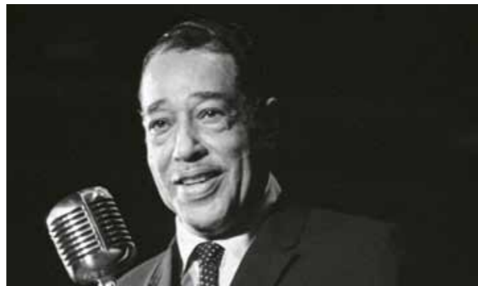
Duke Ellington (1964)