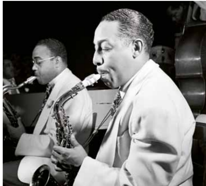
Johnny Hodges (1946)

schuf damit eine Art Collage seines künstlerischen Schaffens bis zu diesem Zeitpunkt. Nicht ohne Grund wurde das gleichnamige Titelstück dieses Konzertes zwei Jahre später mit einem Grammy ausgezeichnet.