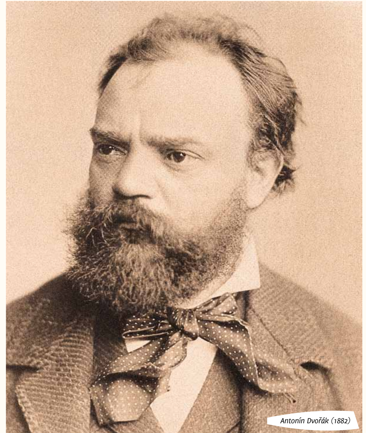
Antonín Dvořák (1882)

Um es vorwegzunehmen: Die Exegese des Glaubenstextes ist nicht primäre Intention von Dvořáks Stabat Mater , obwohl das Werk sicher auch ein Bekenntnis des Komponisten zu seinem Glauben ist. Zwar ließen sich hier und da Nachweise für barocke Symbolik im Notentext finden, aber charakteristisch für die gesamte Komposition ist weniger die theologische Auslegung des Textes. Vorherrschendes Merkmal der Musik ist vielmehr die lyrische Grundstimmung und die hochromantische musikalische Prachtentfaltung, so dass die Komposition eher der kontemplativen Betrachtung als der Illustration des dramatischen Textes dient. >